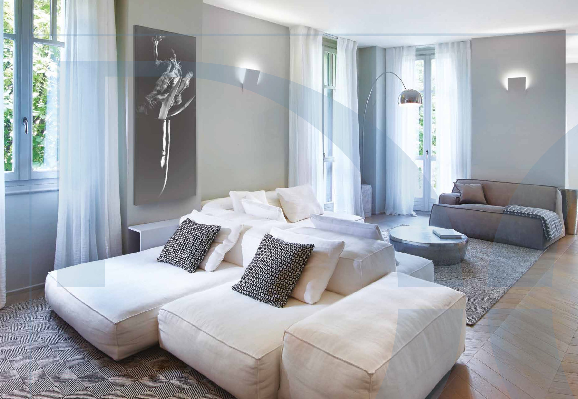
La luce naturale, canalizzata dalle tre porte-finestre velate da leggere tende in tessuto bianco (Domotex snc, Verona), mette in evidenza oltre all'arredo anche la pregiata pavimentazione in legno di rovere posato a "spina alla francese" trattato con una velatura di grigio (SVAI spa, Caselle di Sommacampagna - Vr).