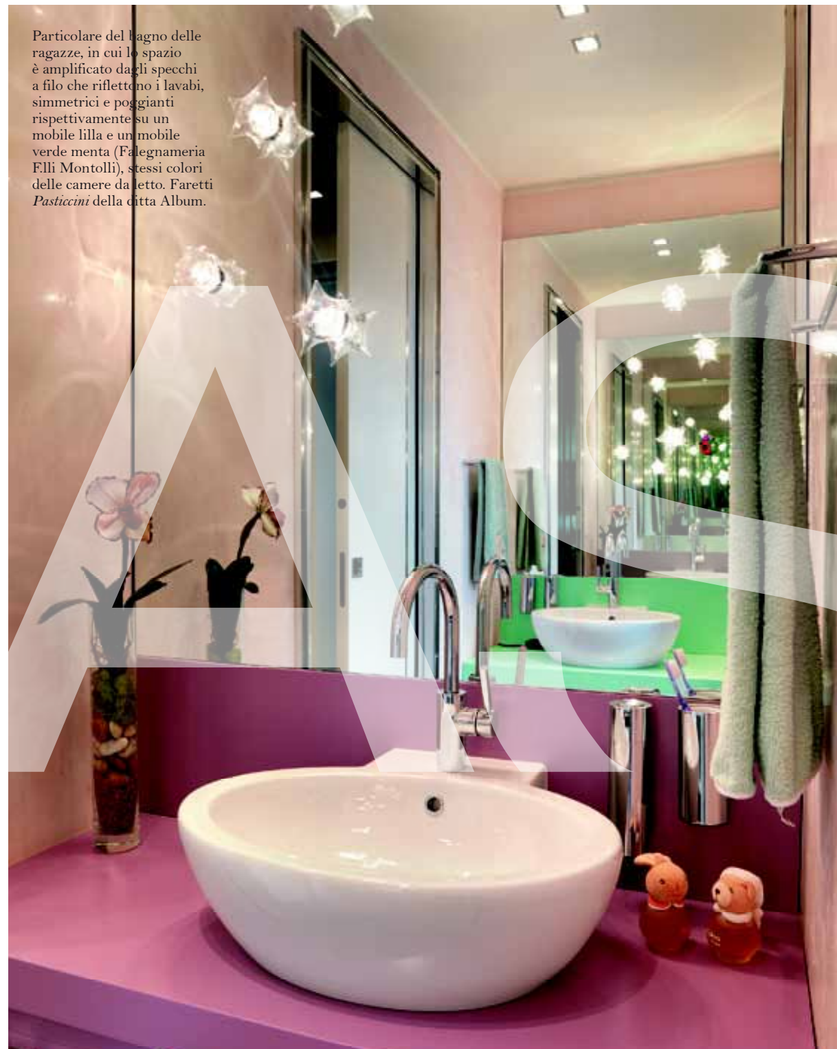
Particolare del bagno delle ragazze, in cui lo spazio è amplificato dagli specchi a filo che riflettono i lavabi, simmetrici e poggiati rispettivamente su un mobile lilla e un mobile verde menta (Falegnameria F.lli Montolli), stessi colori delle camere da letto. Faretti Pasticcini della ditta Album.