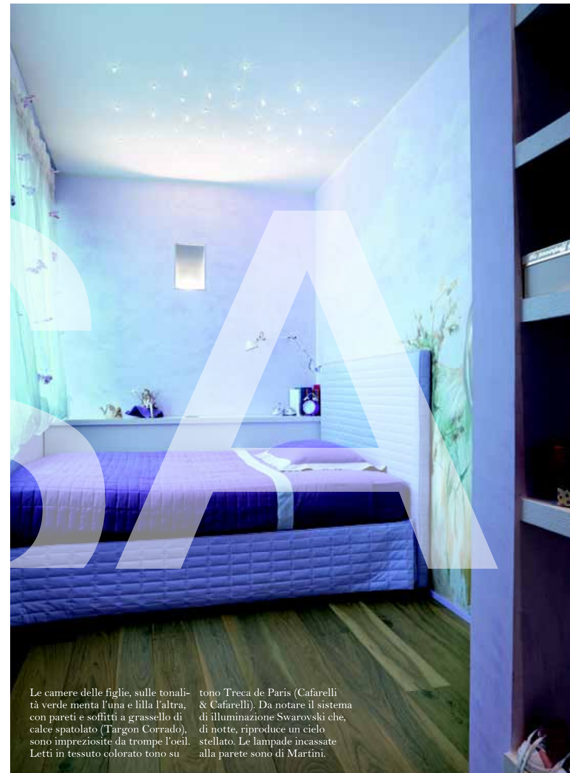
Le camere delle figlie, sulle tonalità verde menta l'una e lilla l'altra, con pareti e soffitti a grassello di calce spatolato (Targon Corrado), sono impreziosite da trompe l'oeil. Letti in tessuto colorato tono su tono Treca de Paris (Cafarelli & Cafarelli). Da notare il sistema di illuminazione Swarovski che, di notte, riproduce un cielo stellato. Le lampade incassate alla parete sono di Martini.